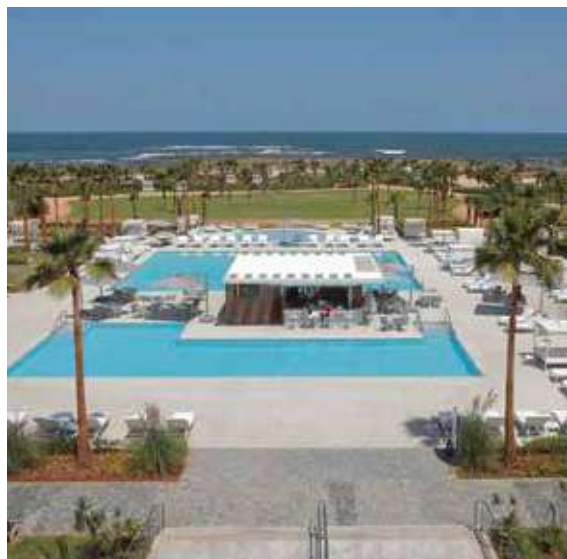
La Région du centre