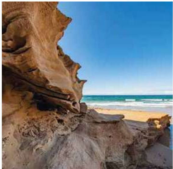
La Région du Sud