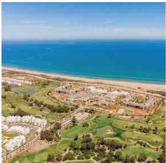
La Région de l'Oriental