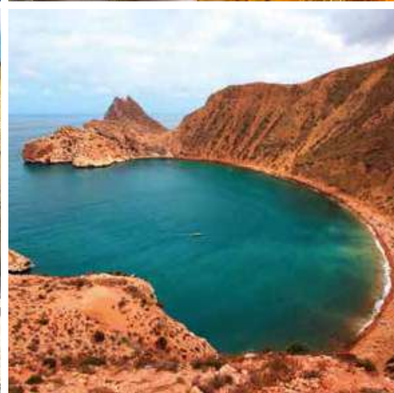
La Région du Nord