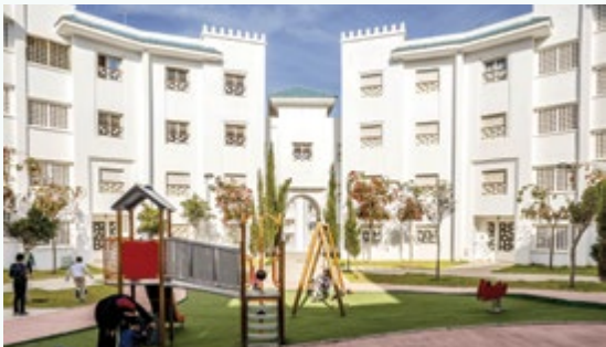
باب سبتة • شقق سطانديك