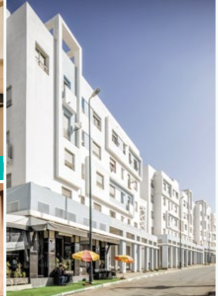
رياض الخير عين عودة • محلات تجارية