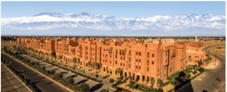
الشويطر • شقق