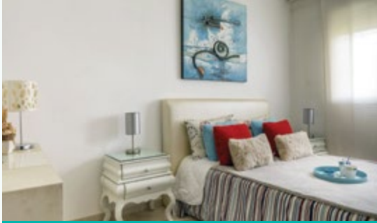
رياض طنجة • شقق إقتصادية