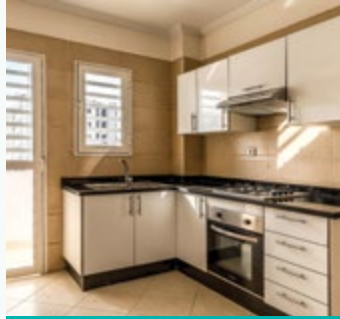
رياض الحي الحسني • شقق سطانديك