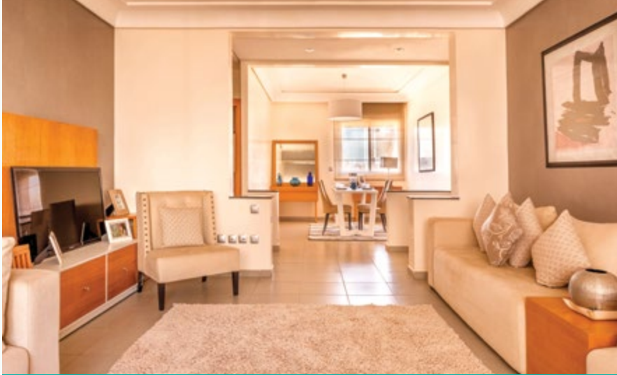
بارك الرحمة • شقق سطانديك