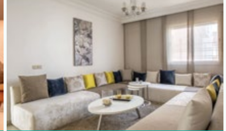
المهدية • شقق إقتصادية