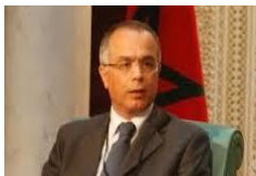
Allocution d'ouverture Chakib BENMOUSSA Ambassadeur du Maroc en France