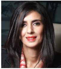
Mme Nadia Fettah ALAOUI Ministre de l'Economie et des Finances Présidente