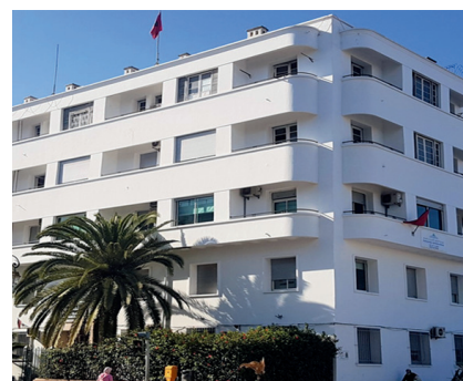
Le siège de l'IDF à Rabat

À noter que Le CRC relevant du Ministère du Finance du Niger est un centre précieux d'échanges, d'apprentissage, de partage d'expériences et de connaissances entre les agents qui œuvrent au fil du temps à la gestion des finances publiques dans un contexte globalisé.