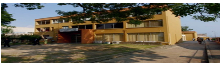
Le siège de l'IEF à Libreville

Les très hautes instructions données par le Président Omar Bongo Ondimba au Premier ministre et au Ministre de l'Economie et des Finances en poste à la fin des années 1970 étaient très claires : créer à Libreville, une école postuniversitaire à même de former des cadres de haut niveau appelés à intégrer les administrations économiques et financières, et les grands organismes publics et parapublics. Dans cette recherche de l'excellence, l'Etat n'avait pas lésiné sur les moyens : une bourse mensuelle de 280 000 FCFA (environ 427€) octroyée à chaque auditeur (élève) et un corps professoral de haut vol composé majoritairement de coopérants français auxquels s'ajoutaient quelques gabonais triés sur le volet. Autres caractéristiques témoignant du caractère élitiste de l'école, l'admission est depuis 1981 soumise à concours. Les candidats non fonctionnaires doivent entre autres, être titulaires d'une maîtrise ou d'un diplôme reconnu équivalent dans une liste de disciplines bien déterminée. Mieux, du fait du basculement du pays au système LMD, tous les candidats non fonctionnaires doivent être titulaires d'un master (bac+ 5). Enfin, tout auditeur peut, au terme de chaque phase de sa formation (Tronc commun, Spécialisation et Stage), être renvoyé s'il n'a pas obtenu une moyenne générale supérieure ou égale à 10/20. Point n'est donc besoin d'attendre dix-huit (18) mois, durée statutaire de la formation à l'IEF.