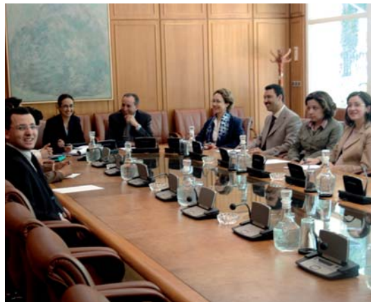
Les membres du comité technique du programme BSG au MFP.

La réussite de la stratégie de développement social est donc tributaire d'une véritable refonte de la politique publique dans le sens de la promotion des principes de bonne gouvernance