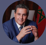
Monsieur Aziz AKHANNOUCH Chef du Gouvernement